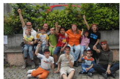
MOMENTO DI FESTA

E' uno dei momenti centrali della vita del gruppo famiglia: gioioso, ricco...imperdibile !!!